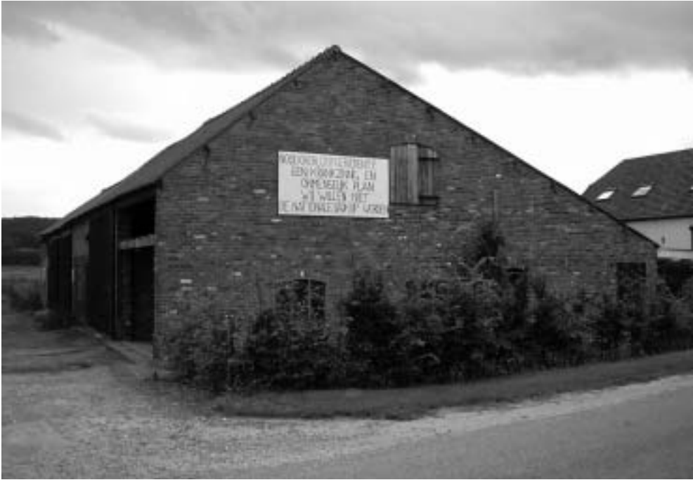
Spandoek in de Ooijpolder.