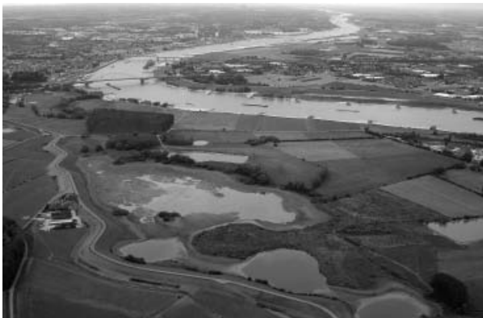
De Ooijpolder en Nijmegen.

‘Vanaf 2006 worden deze uitkomsten en die van het vervolgtraject gebruikt in de discussie over een nieuwe veiligheidsbenadering. Daarin staan het omgaan met overstromingsrisico’s en een mogelijke verdere differentiatie van de veiligheid in Nederland centraal. Dit kan op termijn leiden tot een heroverweging van de huidige normen, bijvoorbeeld een hoger beschermingsniveau voor dichtbevolkte gebieden en een wat lager beschermingsniveau voor dunner bevolkte gebieden. Hierbij past een gedegen communicatietraject over de garanties die het Rijk wel en niet kan bieden’ (Rijksbegroting 2006). 8