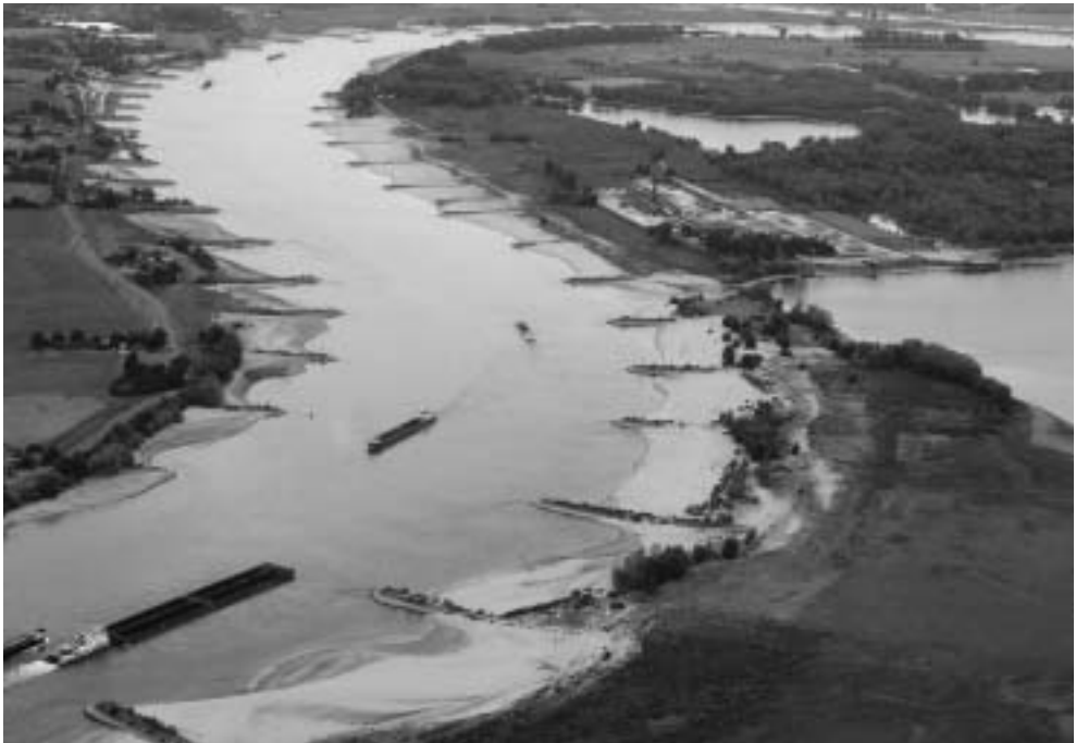
De Waal ter hoogte van de Ooijpolder.

‘Han Vrijling, Matthijs Kok, en Wim Silva stellen: elke dijkring heeft een economisch optimum waarbij kosten en baten in evenwicht zijn. Ik zeg: jullie gaan op de stoel van de politiek zitten. Iedereen moet dezelfde kans hebben, ook al is dat economisch niet optimaal. Ook niet zeuren over 1: 500 of 1:1.000, dat ligt binnen de onzekerheden. In feite moet je logaritmisch werken. Het hele rivierengebied één norm: riviergebied 1:1.000 of 1:10.000, Centraal Holland: 1 op 100.000.’ 25