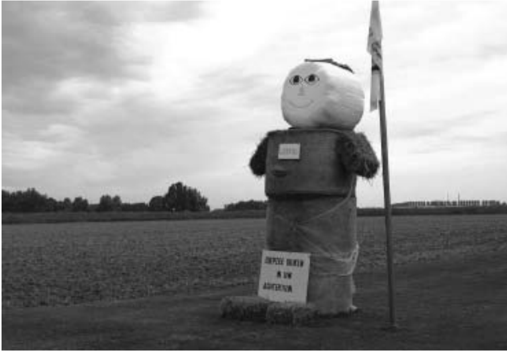
Protest met stropop in de Ooijpolder.